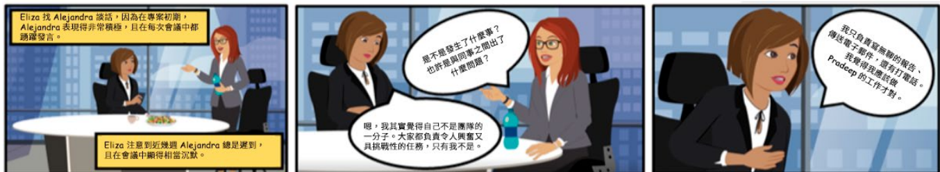
考試中的連環漫畫範例

動畫影片： 在動畫影片題型中，應試者需觀看動畫影片。應試者可重複觀看影片，並使用控制按鈕來播放、暫停、倒帶等。然後，應試者需根據動畫所呈現的情境，回答一題選擇題。我們會在考場向應試者發放耳機。動畫題型會有音訊，也會附帶字幕。