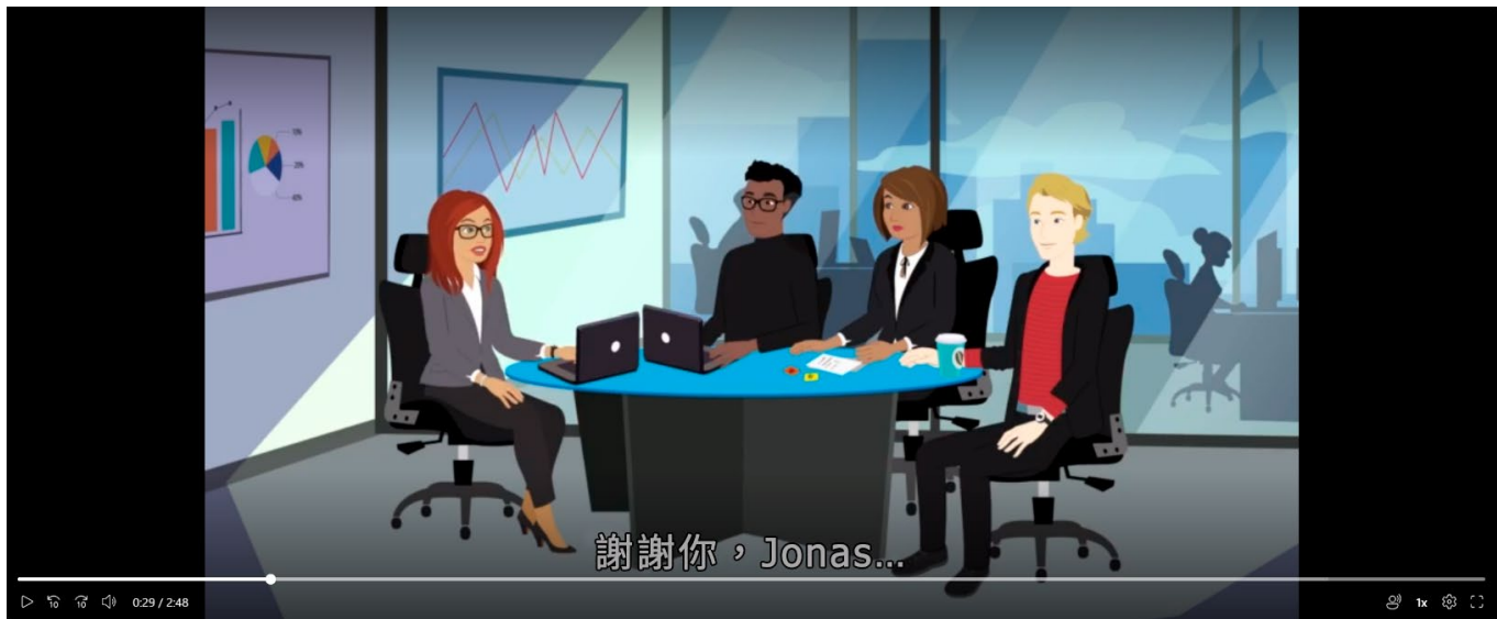
考試中的動畫影片範例